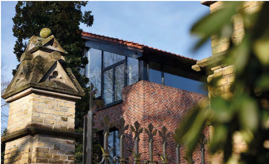
Trauerzentrum am Zentralfriedhof, Foto: Michael Bönke

Grabbesuch – Ort der Erinnerung, Besinnung, Hoffnung und Liebe. Ein Ort der Begegnung zwischen Lebenden und Toten. Die Zeit auf dem Friedhof soll für die Besucher aber auch ein Ort der Freude und der Kommunikation sein. Sich im Miteinander begegnen, Erfahrungen und Erinnerungen austauschen oder in Ruhe eine Tasse Kaffee genießen – der Zentralfriedhof als Ort für Dialog mit Angehörigen, Besuchern und Interessierten. Hier soll das Evangelium in Wort und Tat verkündet und gelebt werden.