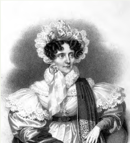
Sophie Gräfin Esterhazy, Lithographie von Josef Kriehuber, 1833

In landschaftlich reizvoller Lage, unweit des Ortes Nordkirchen, liegt die bedeutendste Schlossanlage des Barocks in Westfalen. Schloss Nordkirchen, aufgrund seiner Bedeutung für die Architektur- und Gartengeschichte vielfach als „Westfälisches Versailles“ bezeichnet, ist eingebettet in einen weitläufigen Park, der mit seinen Alleen weit in die umgebende Landschaft ausstrahlt. Das größte Wasserschloss Westfalens samt seiner ausgedehnten Gartenanlagen lassen einen Blick in die Geschichte der Gartenkunst zu. Die jeweiligen Besitzer prägten,